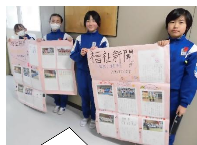
鵜飼小の活動の様子を伝える新聞

校舎内を回っていると、6年生教室前には卒業までの「カウントダウンカレンダー」が掲示されていました。一日一日、めあてをもって生活しようというメッセージが書かれていました。また、福祉委員会では、学校行事などの様子を伝える新聞を作成し掲示をするところでした。掲示後には近隣の施設にお届けし、読んでいただく予定だそうです。