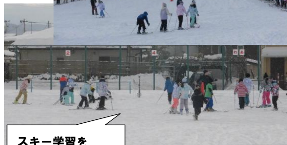
スキー学習を 楽しむ子ども達